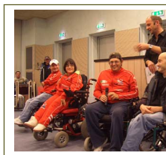
Gli Skorpions Varese

"Lo sport per disabili, conoscerlo e farlo conoscere"